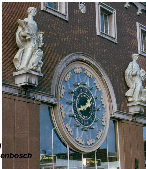
Stationsklok aan voorgevel van NS-station in 's-Hertogenbosch