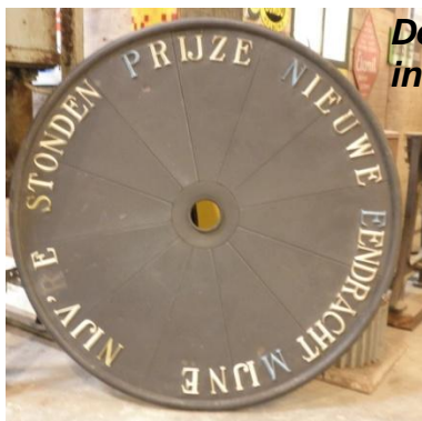
De originele wijzerplaat in de werkplaats